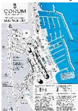
Plan du stade olympique de Kiel

Poser le bateau et filer au camping : éviter de camper trop près des bateaux car beaucoup de bruit la nuit. Remorque de mise à l'eau indispensable. Prévoir boules Kiès. Un vélo est un plus qui vous permettra de camper le plus loin possible du bruit (dancing sur le port jusque vers 2h du matin). On trouve de quoi manger sur place : petit déjeuner et divers stands de restauration. Sanitaires complets en très bon état (jeton à 50 centimes d'Euros pour une douche).