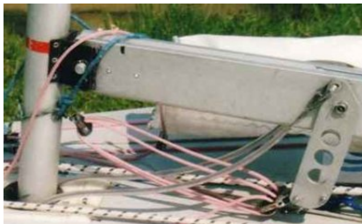
Hale-bas à levier

Très efficace dans cette configuration, assez léger, son seul inconvénient est un encombrement qui reste important. Le haut du levier rencontre parfois la voile et peut créer une usure inopinée. Le câble inox est avantageusement remplacé par un cordage inextensible plus facile à régler et plus léger.