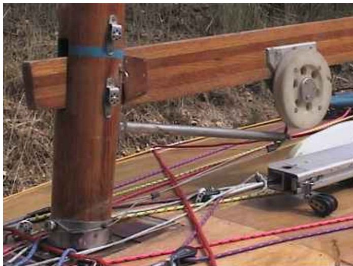
Hale-bas à tambour et jambe de force

Le gros inconvénient est le poids important ainsi que l'encombrement. Les frottements restent importants au niveau du tambour, et les câbles nécessitent une bonne surveillance.