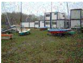
Vue du club de la S.R. Creil.

Une des plus grosses flottes de Yole-OK.