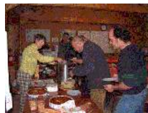
Vue détaillée du club. Après l'effort, le réconfort.

Ce plan d'eau est du côté de Chantilly, tout prêt de Gouvieux.