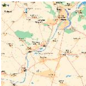
Plan de situation de la SR Creil Le plan d'eau est entre l'Oise et Villers sous Saint-Leu

Ce plan d'eau est du côté de Chantilly, tout prêt de Gouvieux.